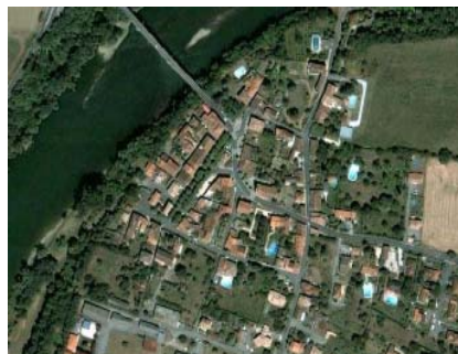
Mauzac vue d'en haut