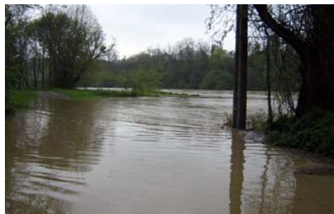
① Exemple de débordement

Ce fleuve, ils le franchissaient au moyen d'un gué. La Garonne étant alors décrite comme un fleuve plutôt capricieux, la traversée s'avérait souvent des plus aléatoires à cause des débordements fréquents ①.