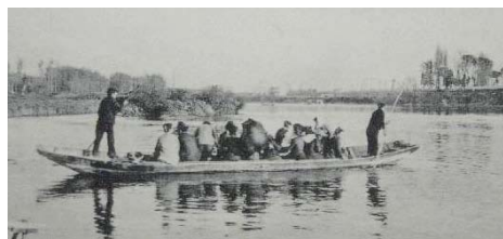
② Illustration de ce que devait être le bac

Il semble certain qu'au moins un gué fut utilisé mais il n'était sûrement pas localisé de façon permanente ; il pourrait se situer au pied même du village, au niveau du pont actuel. Plus tard, il devint encore plus impératif de traverser, étant donnée la configuration particulière de Mauzac : le village sur une rive, la seigneurie sur l'autre. La nécessité d'un bac pour la communauté est attestée dès 1262 dans la charte des coutumes.