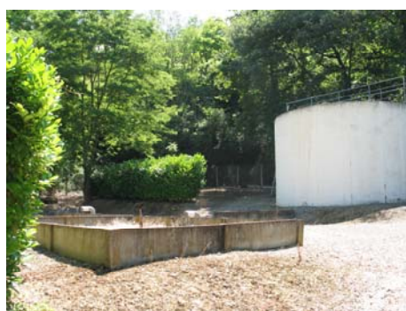
Station d'épuration actuelle non conforme

vous avons écrit notre inquiétude sur la conformité de notre station, inquiétude malheureusement fondée.