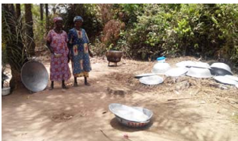
SENEGAL - cantine de l'école