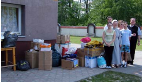
POLOGNE - maison de jeunes mamans

En Pologne, fin 2013, nous avons acheminé 10 m3 de matériel à Stalowa Wola, pour la maison de retraite, l'orphelinat et la maison des jeunes mamans de cette ville des Basses-Carpates.