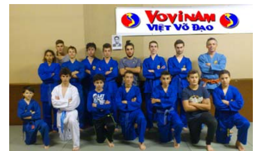
Pratiquants Viet Vo Dao 2014-2015